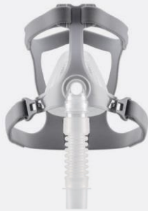
WiZARD 310 Masque nasal

Les WiZARD 310 et 320 sont dotés d'un cadre flexible et d'un contour qui apportent un confort supplémentaire et vous aident à dormir toute la nuit.