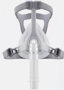
WiZARD 320 masque intégral