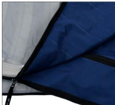
Gaine de qualité supérieure