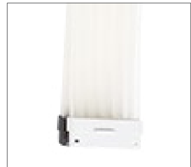
Connecteur sécurisé et résistant à la torsion